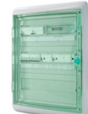
Schakelkast 2 met 2 zones ijsmelder