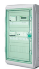
Schakelkast 1 met 1 zone ijsmelder

De ijsmelder schakelkast van EBERLE staat voor een perfecte oplossing uit een hand. Zo bespaart u tijd en kunt u zich om wezenlijkere zaken concentreren. Tevreden klanten gegarandeerd.