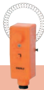
RAR 875 02