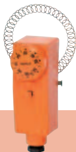
RAR 875 01